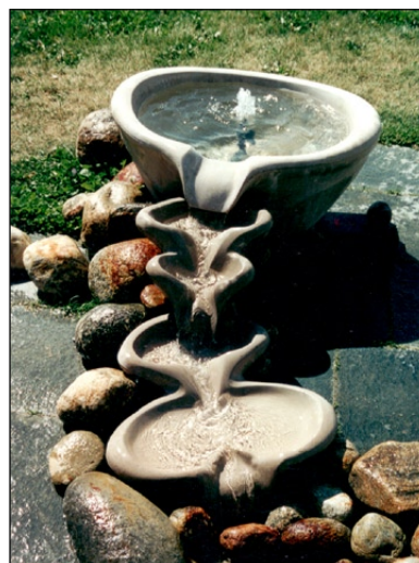
Stensund Fontän inloppskar.