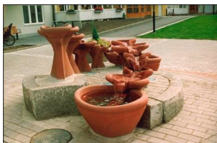
Stensund vattentrappa på sockel med Fontän slutkar. Allt i terracotta-färgad slätbetong.

Virbela Ateljé, Mölnbovägen 25 K, 153 32 Järna TEL: 08 551 50 335 MAIL: virbela@flowforms.se WEBB: www.flowforms.se