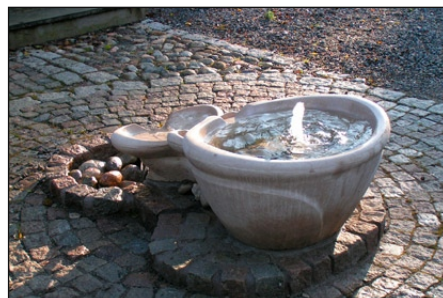
Stensund Fontän inloppskar.