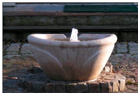
Stensund Fontän inloppskar, vit slätbetong